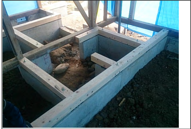
間取り変更に伴う基礎増設② (基礎出来型状況) ※玄関付近