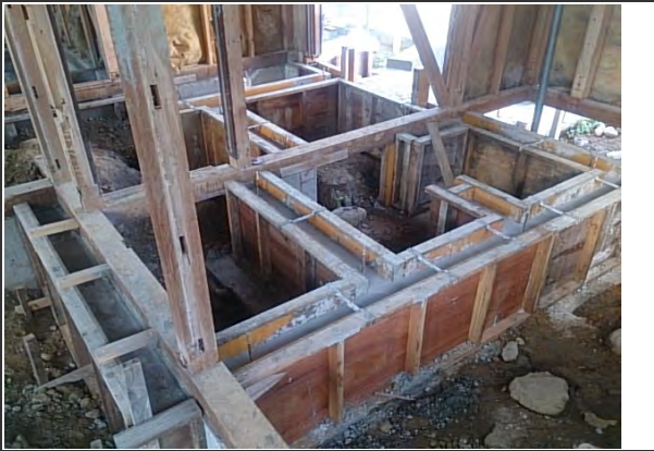
間取り変更に伴う基礎増設① (硬化養生状況) ※玄関付近