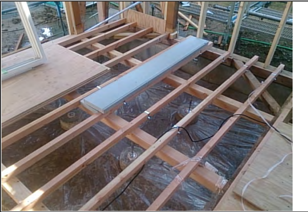
1階床垂木施工状況