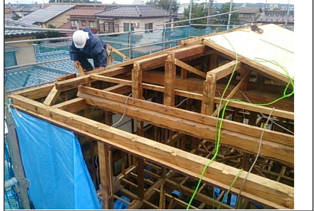
梁・桁 状況 (2)