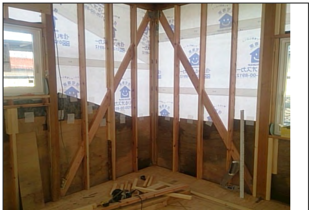
2016.11/5 D通り-③ 耐力面材 設置状況