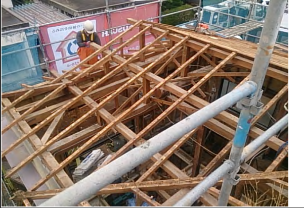
梁・桁 状況 (1)