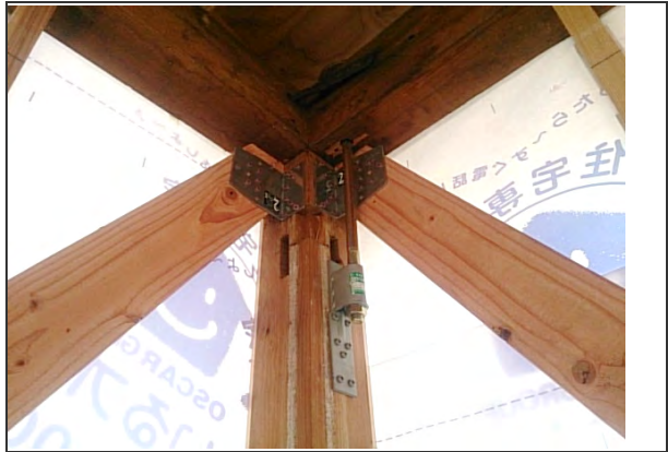
耐震金物施工状況 (耐震性能に伴う構造金物施工の一部) ※リビング付近