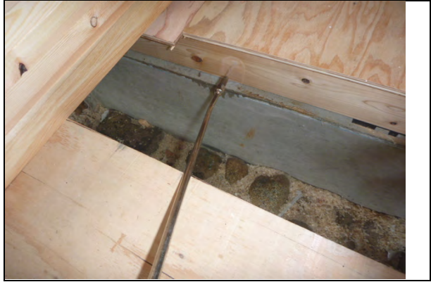
土台・床根太部防蟻処理状況 (虫害防止措置) ※玄関付近