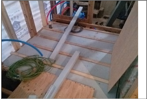
1階床断熱施工状況