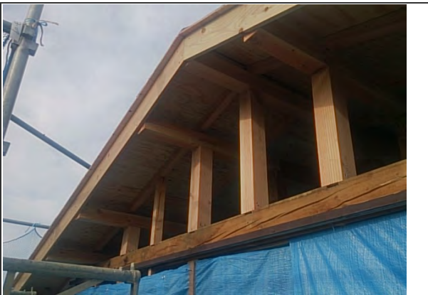
梁・桁 状況 (3)