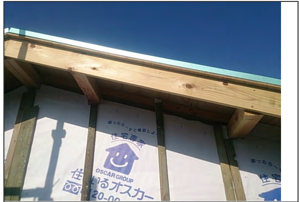
外壁 2次防水 施工状況 (4)