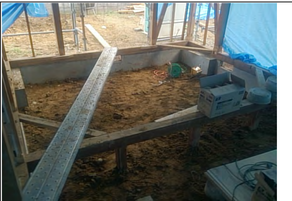
床下内部不足土砂搬入 (床下内湿気対策措置) ※リビング付近