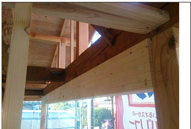
構造強度に伴う梁補強状況 (構造梁補強の一部) ※リビング付近