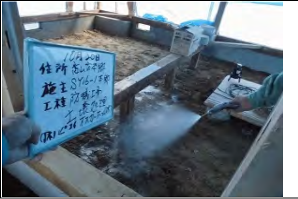
床下土壌部防蟻処理状況 (虫害防止措置) ※リビング付近