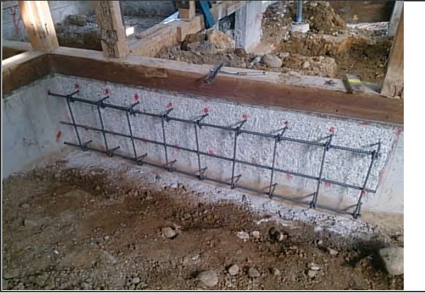
耐震性能に伴う基礎補強施工① (差筋アンカー配筋状況) ※主寝室付近