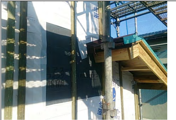
2016.11.15 1階リビング サッシ廻り 防水施工 状況