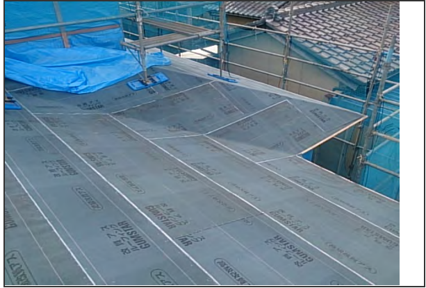
屋根 2次防水 施工状況 (2)