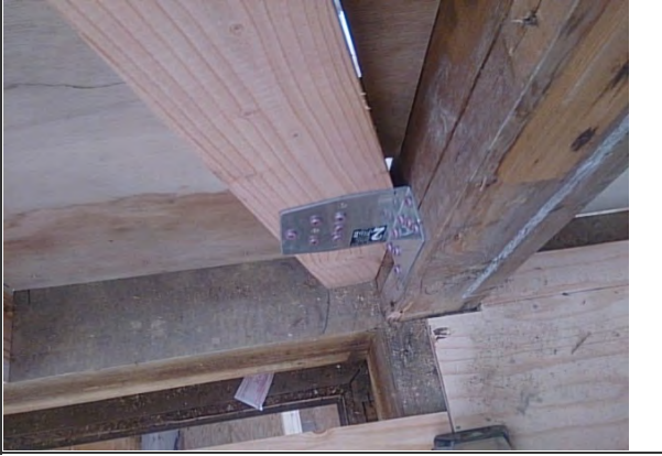
2016.11/5 耐震補強 実施 A通り-② ホールダウン金物 設置状況