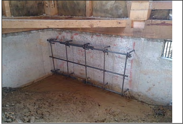
耐震性能に伴う基礎補強施工② (差筋アンカー配筋状況) ※リビング付近