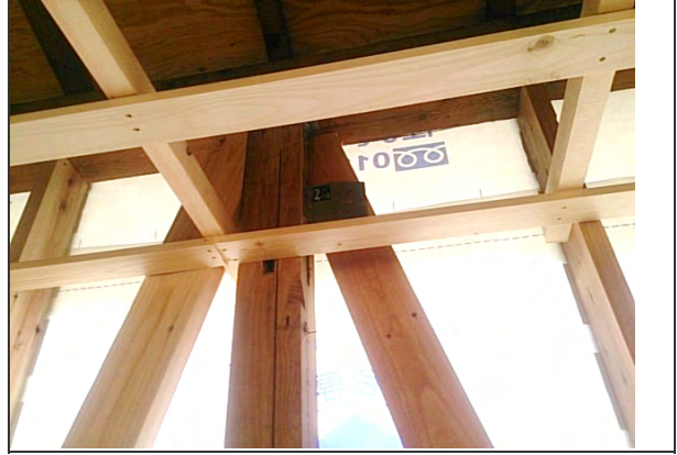
2016.11/5 D通り-③ 耐力面材 設置状況