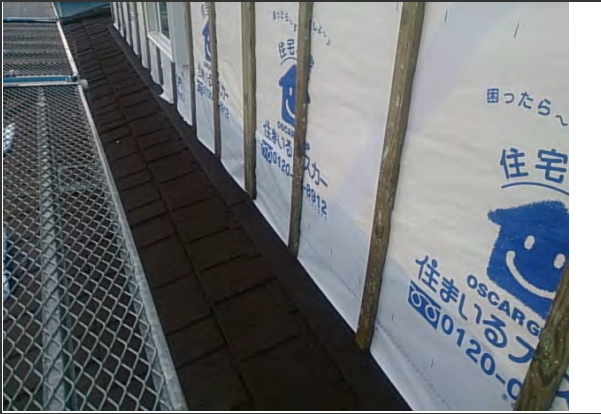
屋根 下地 施工状況 (1)