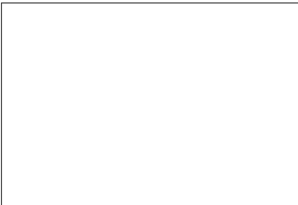
外壁 下地 施工状況 (3)