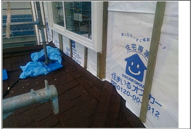
屋根 下地 施工状況 (2)