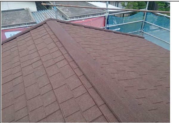
屋根材 施工状況 (1)