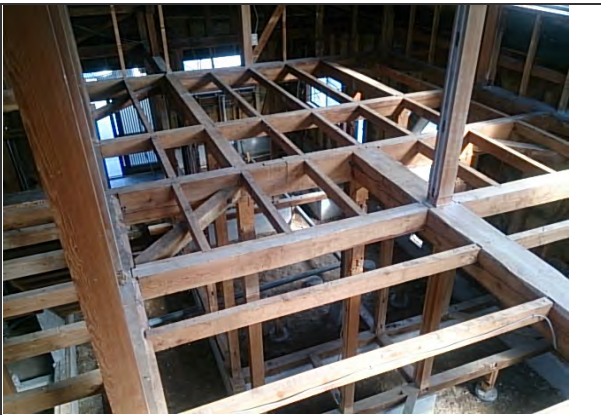
2階床根太状況 (老朽部も無く健全な状態) ※洋室付近