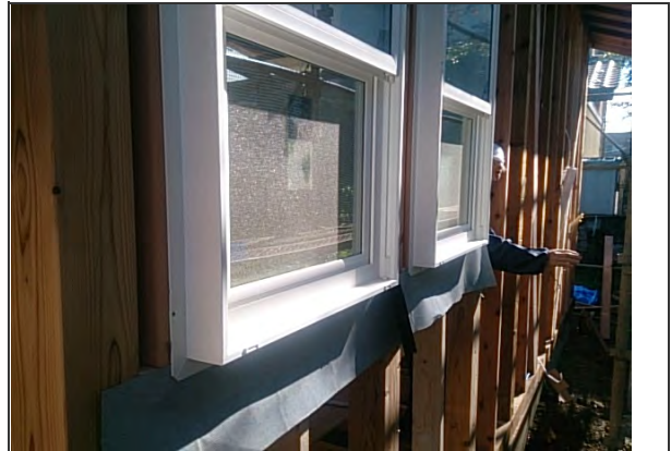
2016.11.15 2階寝室 サッシ廻り 防水施工 状況