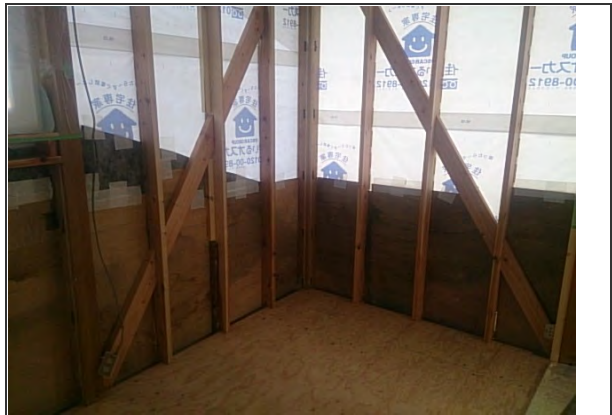
2階床合板敷設状況 (不陸調整後の施工状況) ※洋室付近