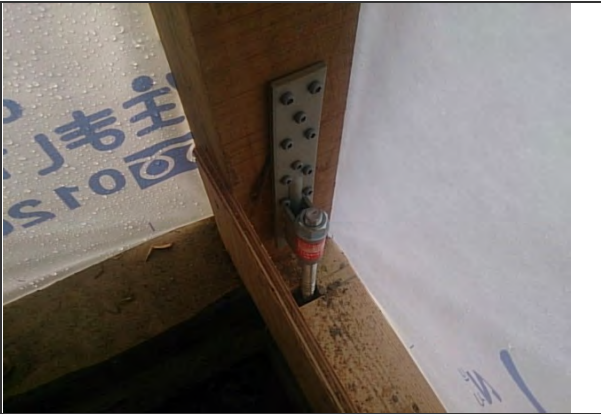
ホールダウン金物施工状況 (耐震性能に伴う構造金物施工の一部) ※リビング付近