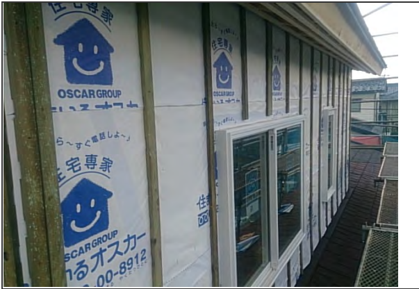
外壁 2次防水 施工状況 (3)