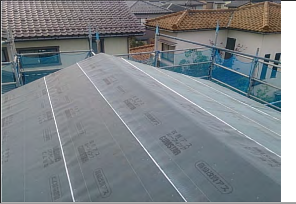
屋根 2次防水 施工状況 (1)