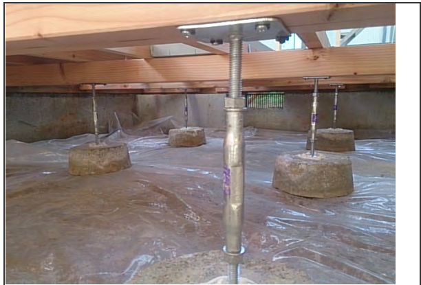
床下土砂面ポリシート敷設 (床下土砂からの湿気防止措置) ※リビング付近